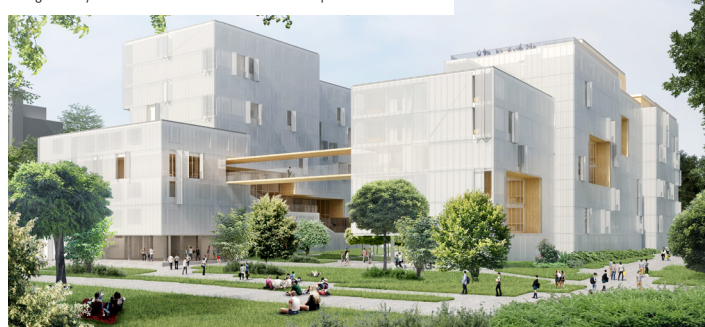
Image de synthèse de la nouvelle résidence pour étudiants

L'Institut construit une nouvelle résidence pour étudiants de 650 lits. Kengo Kuma, architecte de renommée mondiale, a été choisi à l'issue d'un concours sur invitation pour réaliser le projet.