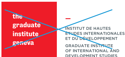
Le caractère a été modifié