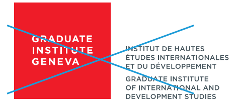
Suppression d'éléments («THE» et la barre rouge)