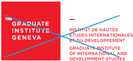
Modification de la couleur (texte)

Exemples de mauvaise utilisation du logo: