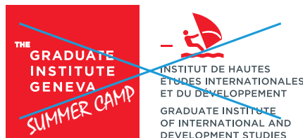
Plusieurs éléments ont été ajoutés