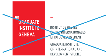
Taille non proportionnelle (déformation)