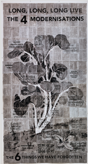
William Kentridge, Long, Long, Long Live the 4 Modernisations , 2014, encre de Chine, crayon rouge, impression digitale sur papier trouvé, 339 × 178,2 cm