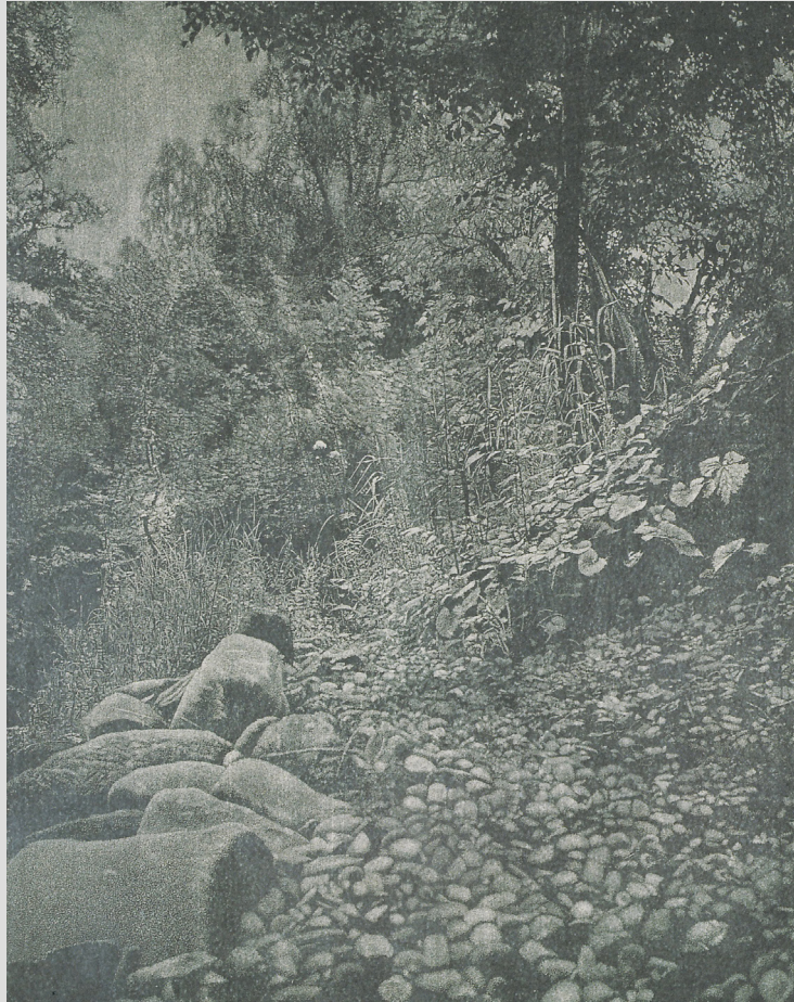
Franz Gertsch, Rüschegg I , 1988-1989, xylogravure sur papier Kumohadamashi, 234 × 181 cm / 276 × 217 cm