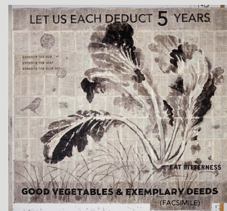
William Kentridge, Good Vegetables & Exemplary Deeds , 2014, encre de Chine, crayon rouge, impression digitale sur papier trouvé, 231 × 252 cm