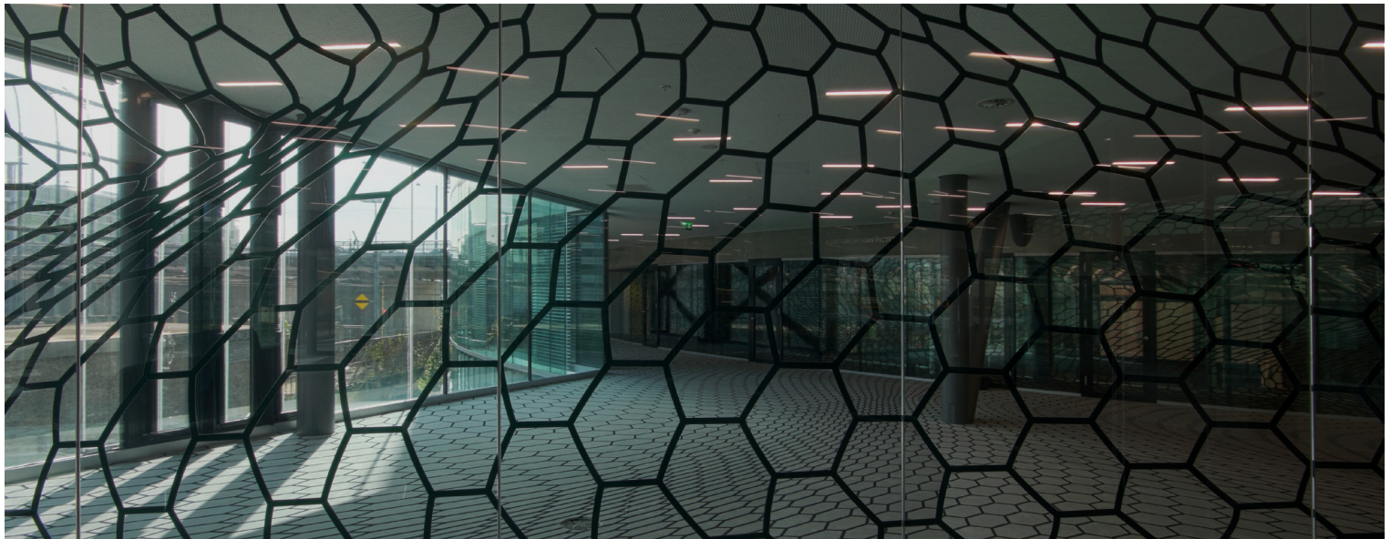
Peter Kogler, sans titre , 2013, moquette et adhésif, dimensions variables.