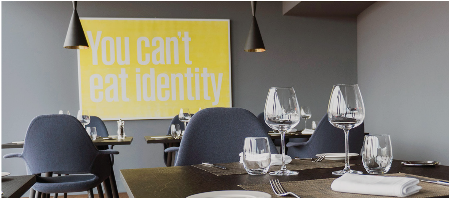
Superflex, You Can't Eat Identity/200 Euro , 2015, acrylique sur toile, 120 × 180 cm.